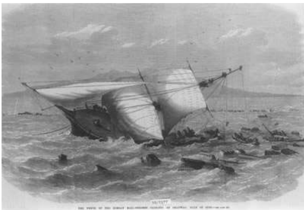
Bezapelacyjnie najbardziej elegancki wrak wód egipskich. TO skarb pochodzący z okresu nostalgicznych żaglowców.

Carnatic był typowym statkiem żaglowo- parowym z 1860 roku. Zbudowany przez Samuda Bros na wyspie Dogs, w Londynie. Miał 90 metrów (294 stopy) długości, ważył 1776 ton i mógł pomieścić 250 osób. Choć wyposażony był w prymitywne silniki o mocy 12 węzłów należał do rodziny żaglowców. Ten słynny statek był luksusem w tamtych czasach. Bez wątpienia jest też najbardziej eleganckim wrakiem w wodach Egiptu.